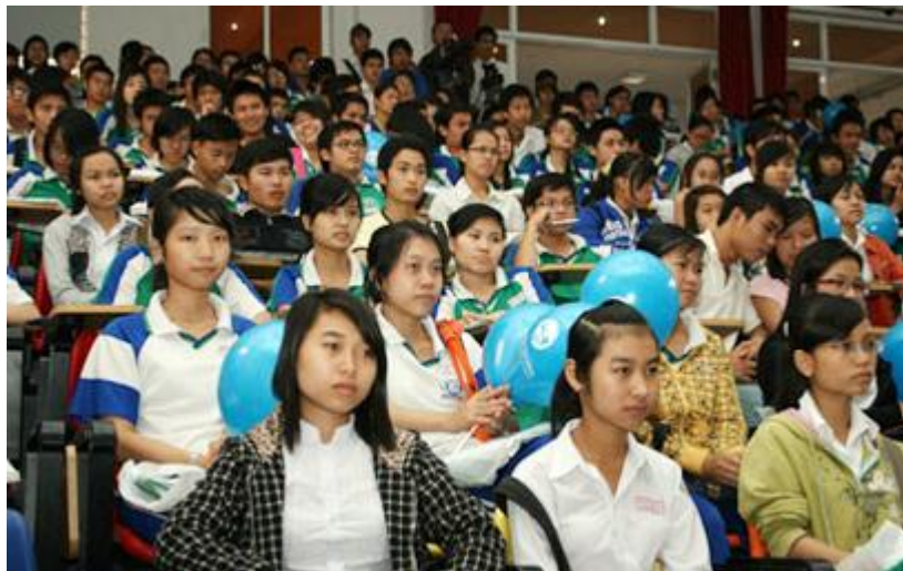
Các học sinh THPT tại TP Đà Nẵng tham gia buổi tư vấn

(TNO) Sáng 15.3, hơn 1.000 học sinh các trường THPT trên địa bàn TP Đà Nẵng tập trung về trường ĐH Duy Tân (đường Quang Trung, TP Đà Nẵng) để tham dự chương trình Tư vấn mùa thi năm 2010 của Báo Thanh Niên .