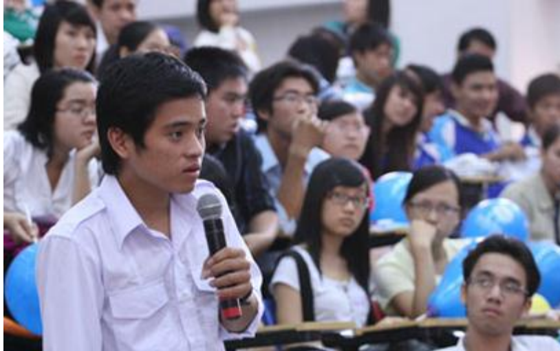
Học sinh trường Phạm Phú Thứ, trường miền núi còn nhiều khó khăn, đặt câu hỏi tại buổi tư vấn