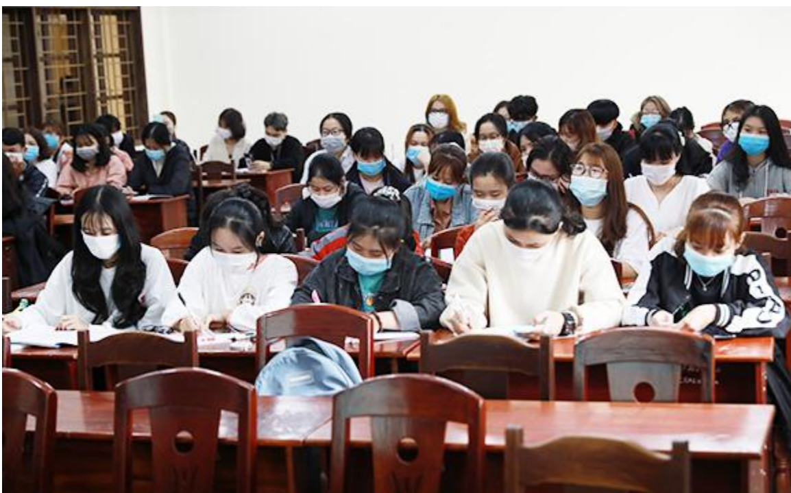
Sinh viên đeo khẩu trang, chấp hành nghiêm chỉnh quy định của nhà trường

Các khuyến cáo, hướng dẫn của Bộ y tế về giải pháp ngăn ngừa nhiễm bệnh và lây nhiễm dịch đã được nhà trường thông tin liên tục qua các kênh. Cùng với đó là việc đảm bảo tối đa sự an toàn trong khuôn viên trường và phòng học, sinh viên Duy Tân có thể yên tâm học tập, sinh hoạt để có một học kỳ học thú vị và ngập tràn năng lượng.