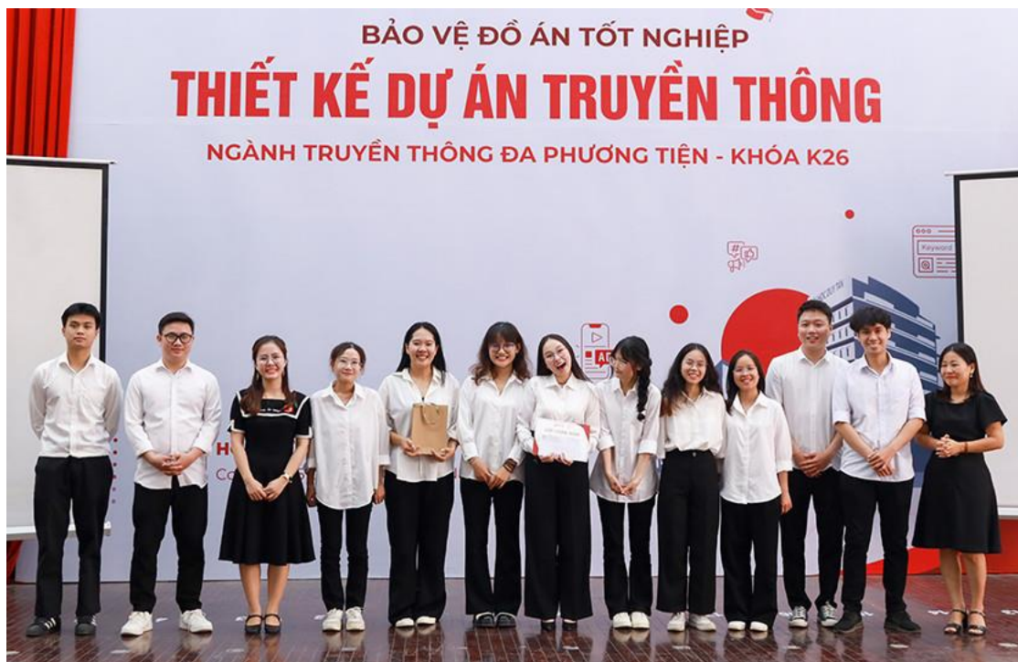
Nhóm NBO Creative giành giải Nhất với dự án

Sinh viên khóa K26 ngành Truyền thông Đa phương tiện đã được chia thành 5 nhóm để thực hiện 5 dự án truyền thông khác nhau. Trải qua 40 ngày với nhiều khó khăn và thử thách, các nhóm sinh viên đã hoàn thiện được dự án của mình để trình diện trước hội đồng ban giám khảo. Mỗi nhóm có thời gian 20 phút để trình bày Proposal cùng với Demo khả thi từng dự án.