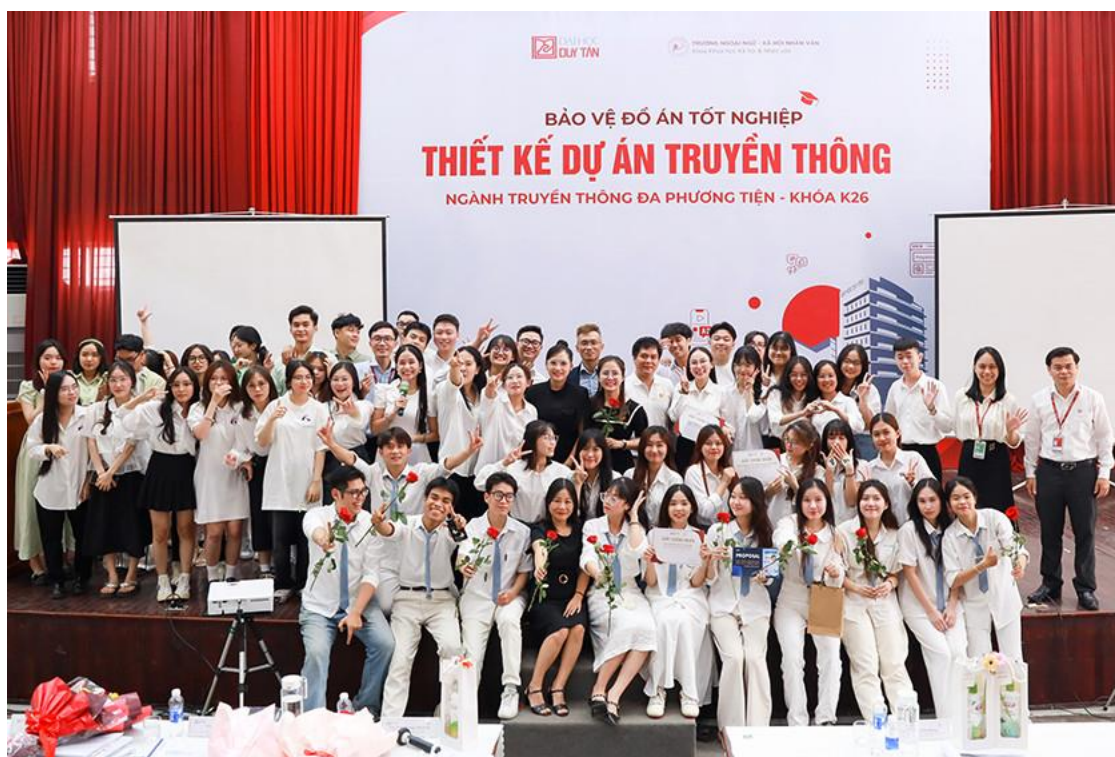
Buổi Bảo vệ Đồ án Tốt nghiệp đã khép lại những năm tháng sinh viên tươi đẹp tại Đại học Duy Tân của các sinh viên K26 ngành Truyền thông Đa phương tiện

- Nhóm NBO Creative với dự án “Thiết kế dự án Truyền thông cho thương hiệu bia Huda kết hợp cùng Xanh SM”.