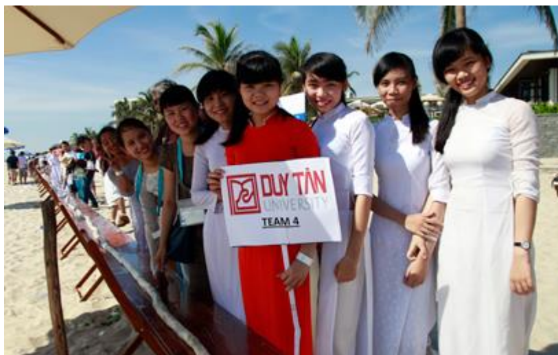
Sinh viên Duy Tân với chiếc gỏi cuốn dài nhất thế giới

Để thực hiện chiếc gỏi cuốn lớn nhất thế giới, hơn nửa tấn nguyên liệu gồm thịt gà, tôm, bún tươi, bánh tráng, rau thơm đã được quy tụ về một trong những bãi biển đẹp nhất hành tinh tại Tp. Đà Nẵng. Trong những tà áo dài truyền thống Việt Nam và các trang phục đầu bếp, sinh viên đến từ Đại học Duy Tân, trường Cao đẳng Nghề Việt-Úc và Trường Cao đẳng quốc tế Pegasus cùng gần 100 du khách quốc tế là các chuyên gia, nhà quản lý hàng đầu trong lĩnh vực du lịch, hàng không châu Á, các nhà cung cấp dịch vụ hàng không... đang tham gia chuỗi sự kiện Diễn đàn quốc tế APOT.Asia - 2014 tại Tp. Đà Nẵng đã cùng gói chiếc gỏi cuốn.