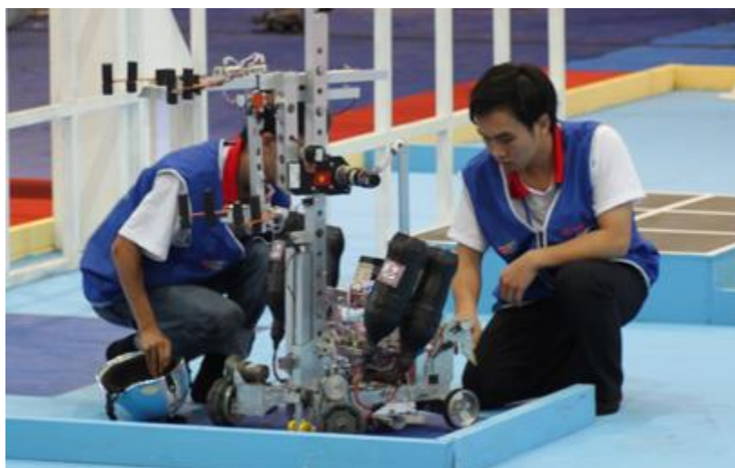
Những chiến binh tiền trạm hoàn thành nhiệm vụ do thám sức mạnh đối phương

Vai trò tiền trạm của Rocking có vẻ khá nặng nề khi họ chỉ đạt giải 3 ở vòng loại cấp trường, vừa ra trận họ phải đối mặt với những hạt giống của mùa giải như BK TME (ĐH Bách Khoa) và CNTT 12 (Sỹ Quan Thông Tin). Và chắc hẳn các cổ động viên đã rất buồn khi liên tiếp hai lần xuất quân các Robot tự động của Rocking đều bị lỗi khiến họ thất thế trước đội bạn. Nhưng đối với những người theo dõi từng bước đi của Robocon DTU thì niềm tin không hề lung lay. Họ biết rõ những viên ngọc còn ẩn dấu và cảm thông cho sứ mệnh tiền trạm của Rocking. Rocking - chiến binh do thám sức lực của đối thủ đã hoàn thành nhiệm vụ. Tất cả mong chờ sự xuất quân của các vị thần.