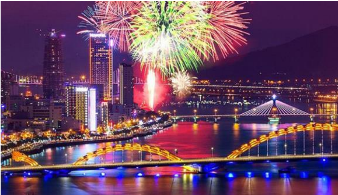
Vẻ đẹp của thành phố biển Đà Nẵng

Những trường như thế sẽ được các bạn trẻ ưu tiên xem xét trong mùa tuyển sinh 2020 năm nay. Nếu những trường đó có được những ngành các bạn thích, có mức học phí phù hợp... thì rõ ràng đây là những trường hoàn hảo để các bạn đăng ký/đổi nguyện vọng.