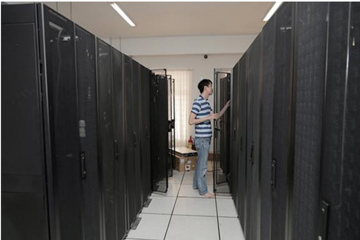
Hệ thống Data Center và thiết bị phục vụ giảng dạy online hiện đại