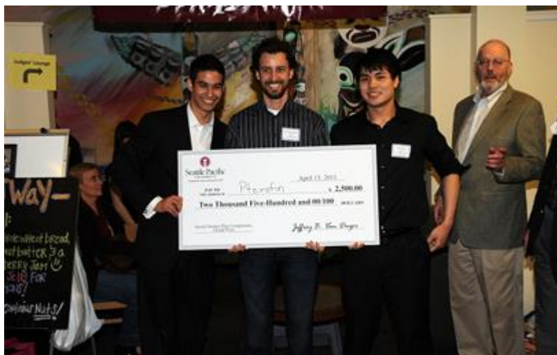
Đội vô địch Pterofin với sản phẩm tạo năng lượng sạch

Người thắng giải cuộc thi năm nay (tổ chức ngày 13/4, từ 2 đến 6 giờ chiều) là đội đến từ Đại học Washington (UW) với dự án tên gọi "Pterofin" và sản phẩm máy phát điện cho nhà cửa, văn phòng và các khu dân cư.