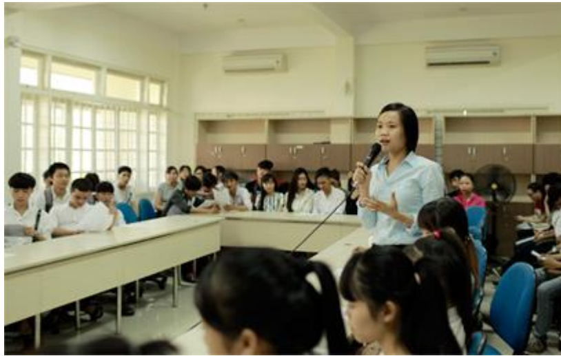
Tân Sinh viên N21 trả lời câu hỏi trong phần giao lưu

Những lời ca, tiếng hát cùng những trò chơi giao lưu vui nhộn đã mang đến cho các Tân Sinh viên Khóa N21 - Khoa Cao đẳng Thực hành, Đại học Duy Tân một buổi giao lưu ấm áp và tươi vui trong sáng ngày 6/9/2015. Đây sẽ là những khoảnh khắc, những kỷ niệm đẹp đầu tiên trong quãng đời sinh viên của các Tân Sinh viên N21.