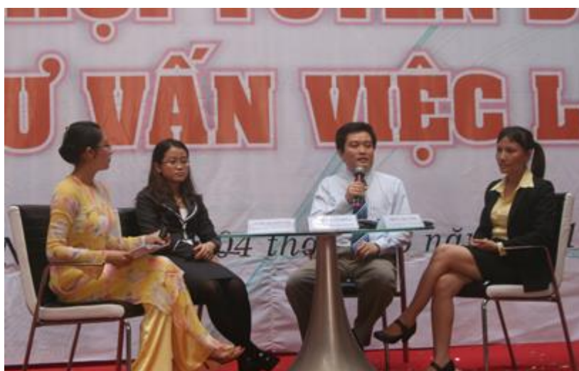
Giao lưu, trao đổi kinh nghiệm tại chương trình

Bên cạnh việc thông tin, tuyển dụng, Ban Tổ Chức cũng đã mời các chuyên gia tư vấn, các lãnh đạo doanh nghiệp hàng đầu tại miền Trung tham gia giao lưu, trao đổi kinh nghiệm, tư vấn định hướng nghề nghiệp cho các bạn tham gia chương trình.