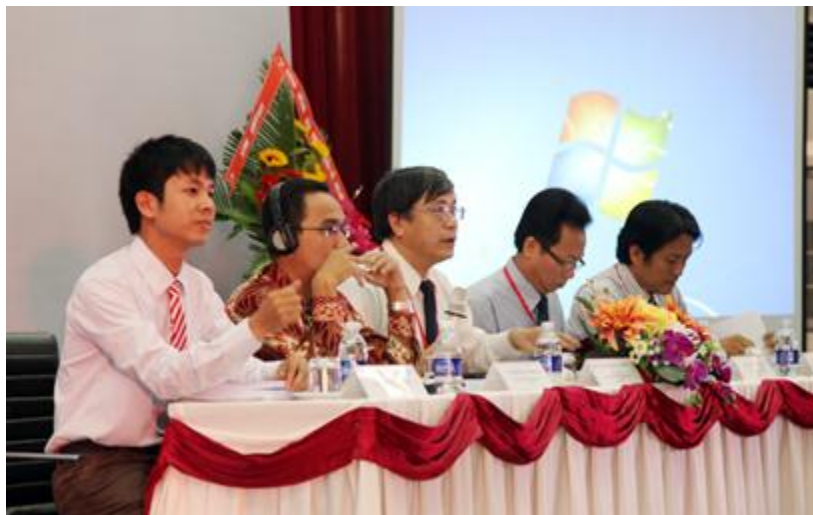
Đoàn Chủ tịch điều khiển Hội thảo

học và Cao đẳng thuộc khối ASEAN, hôm nay chúng ta thực hiện một cuộc hội thảo thú vị dành cho những người làm giáo dục Khu vực Đông Nam Á. Với chủ đề ‘Cộng đồng Asean sau 2015 - Cơ hội và Thách thức’, hội thảo thực sự cần thiết trước tình hình thế giới đang phát triển và nhiều chuyển biến như hiện nay. Trong khi thế giới đang diễn ra rất nhiều các cuộc cách mạng để giải quyết các vấn đề toàn cầu như biến đổi khí hậu, môi trường sống, giáo dục nhằm mang đến cho người dân một cuộc sống tốt đẹp hơn, các nước trong khối ASEAN cũng cần xác định vị thế và hiện trạng từ đó định ra những bước đi phù hợp nhất để phát triển đất nước. Đóng góp vào quá trình đó không thể thiếu lĩnh vực giáo dục trong đó phải kể đến tri thức nhân loại. Tài nguyên thiên nhiên nhiều nhưng cũng đến ngày cạn kiệt nhưng trí tuệ của con người là vô hạn. Phải chăng nếu có, tri thức chỉ bị giới hạn bởi không gian, biên giới cũng như nhận thức của con người. Bởi vậy, chúng ta cần phải tổ chức nhiều hơn nữa các hội thảo thiết thực như hôm nay để các trường đại học, cao đẳng cùng kết nối, hiến kế vì một ASEAN bền vững và phát triển trong tương lai."