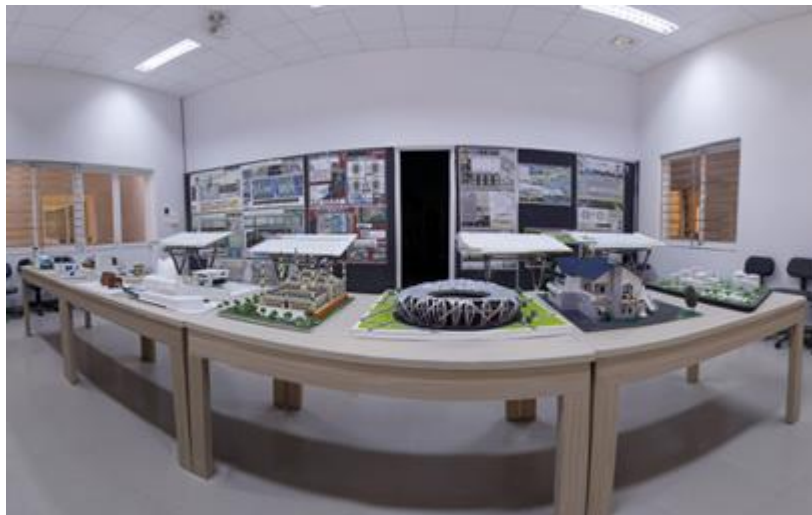
Phòng trưng bày sản phẩm đồ án thiết kế của sinh viên Khoa Kiến trúc

Là trường ngoài công lập với hơn 20 năm phát triển, được sự ghi nhận của Chính phủ, Bộ Giáo dục & Đào tạo cũng như của xã hội, Đại học Duy Tân đã tạo dựng được thương hiệu và uy tín trong dòng chảy giáo dục nước nhà. Đồng thời, Đại học Duy Tân luôn quan tâm chia sẻ gánh nặng kinh tế với phụ huynh và sinh viên, mà trọng tâm là sự bình ổn về học phí. Các năm qua, Đại học Duy Tân liên tục ban hành nhiều chế độ học phí ưu đãi cùng nhiều chính sách hỗ trợ sinh viên vay vốn, giảm học phí với những suất học bổng giá trị dành cho các sinh viên có thành tích học tập xuất sắc.