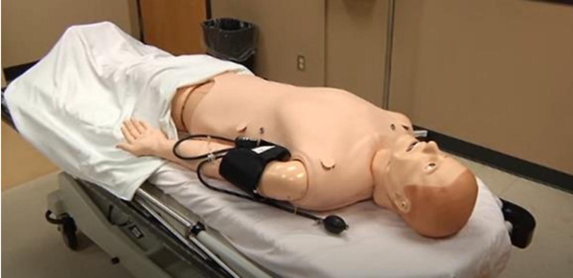
Sinh viên ngành Y khoa và Nha khoa của ĐH Duy Tân được học tập trên các mô hình mô phỏng, robot manequin y tế với trị giá từ hàng chục đến hàng trăm ngàn đôla Mỹ như các mô hình Laerdal, eNasco, Harvey, Little Anne ở Trung tâm MedSIM của DTU