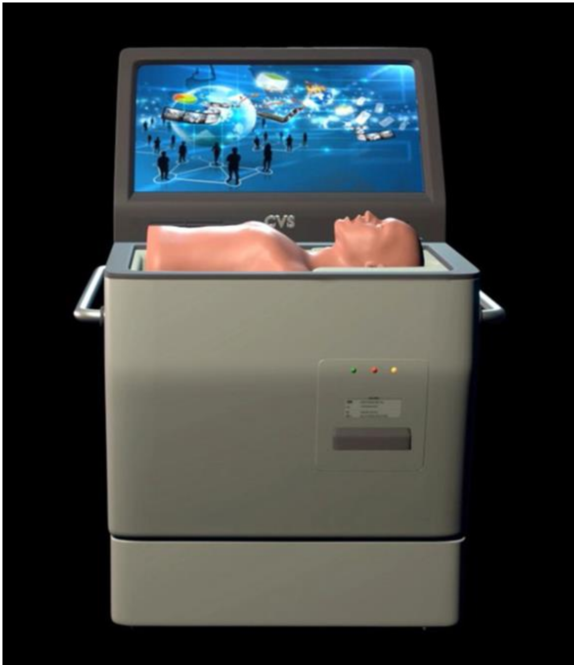
Sản phẩm eCPR: hệ thống huấn luyện kỹ năng sơ cấp cứu hồi sức tim, phổi vì cộng đồng được bình chọn là sản phẩm xuất sắc của ngành Phần mềm, Công nghệ Thông tin (CNTT) Việt Nam và được công nhận Danh hiệu Sao Khuê 2020.