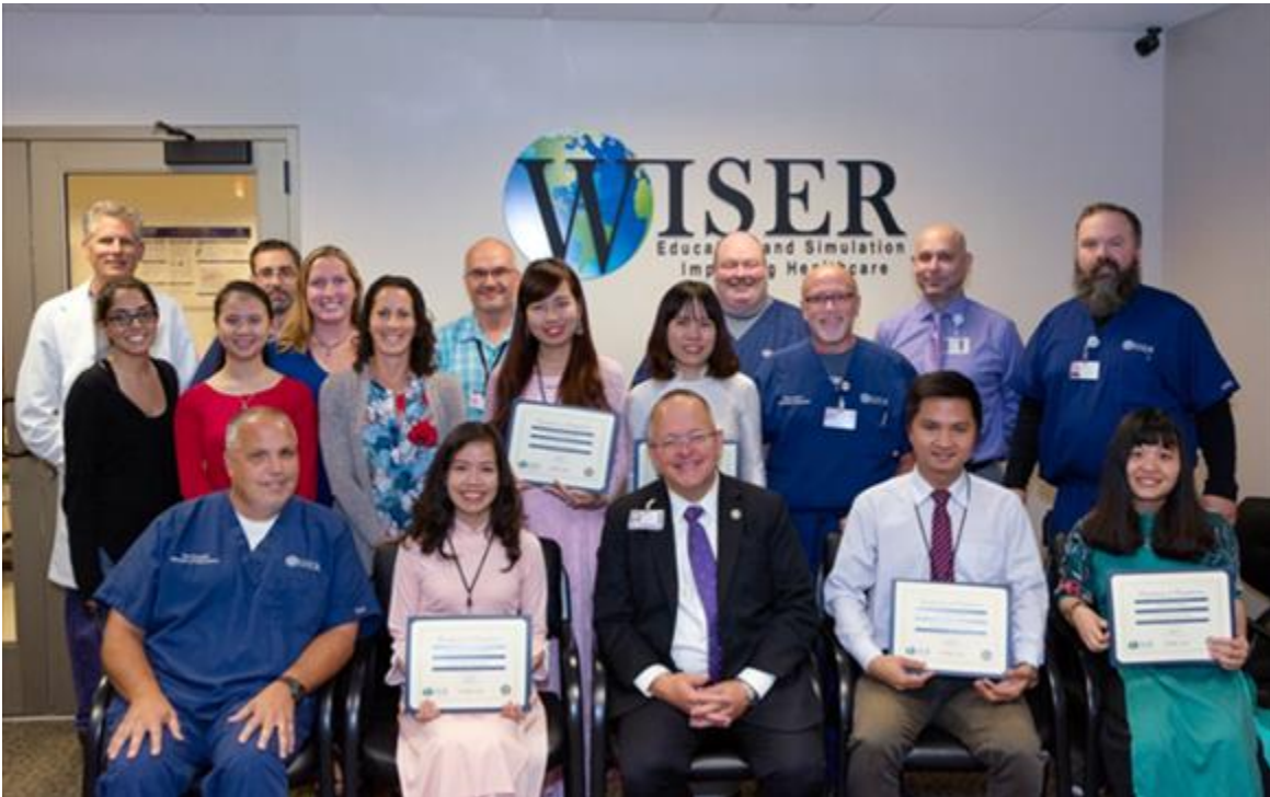
Lễ tổng kết Trao Giấy chứng nhận cho đoàn giảng viên ĐH Duy Tân khi kết thúc thời gian 8 tuần tập huấn tại Trung tâm WISER, UPMC, Pittsburgh, PA (Hoa Kỳ) vào mùa hè năm 2018

Cơ sở vật chất: Các phòng thí nghiệm, thực hành hiện đại với các công nghệ hàng đầu thế giới