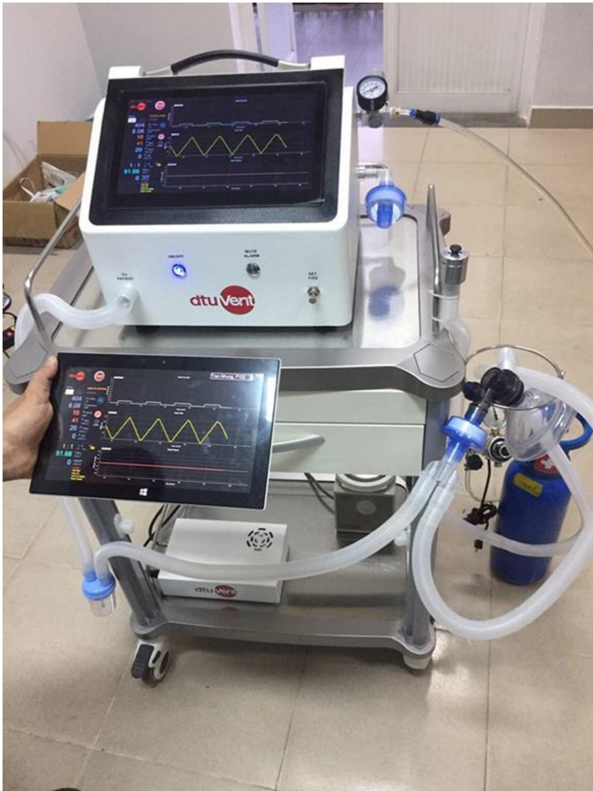
Máy thở “dtu-VENT Ver2.0” với đầy đủ các chức năng của một máy thở y tế chuyên nghiệp, đáp ứng các thông số cấp cứu và điều trị bệnh nhân COVID-19. Với thiết kế “2 trong 1”, máy thở tích hợp cả chức năng “thở không xâm nhập” và “thở xâm nhập” vào một, bên cạnh những chức năng hiện đại khác