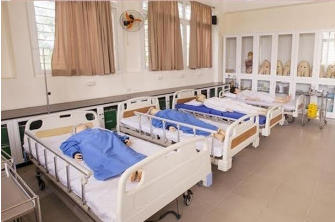
Sinh viên được trực tiếp thực hành trên các mô hình cụ thể,...