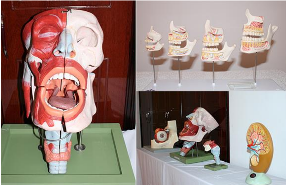
... và làm thí nghiệm với hệ thống trang thiết bị hiện đại

Lợi thế về cơ sở vật chất hiện đại và đội ngũ giảng viên cán bộ được đào tạo, huấn luyện bài bản ở nước ngoài (phần lớn ở Mỹ) đã giúp ĐH Duy Tân chế tạo ra nhiều sản phẩm hữu ích phục vụ cho công tác dạy và học cũng như hỗ trợ phòng chống, khám và chữa bệnh cộng đồng.