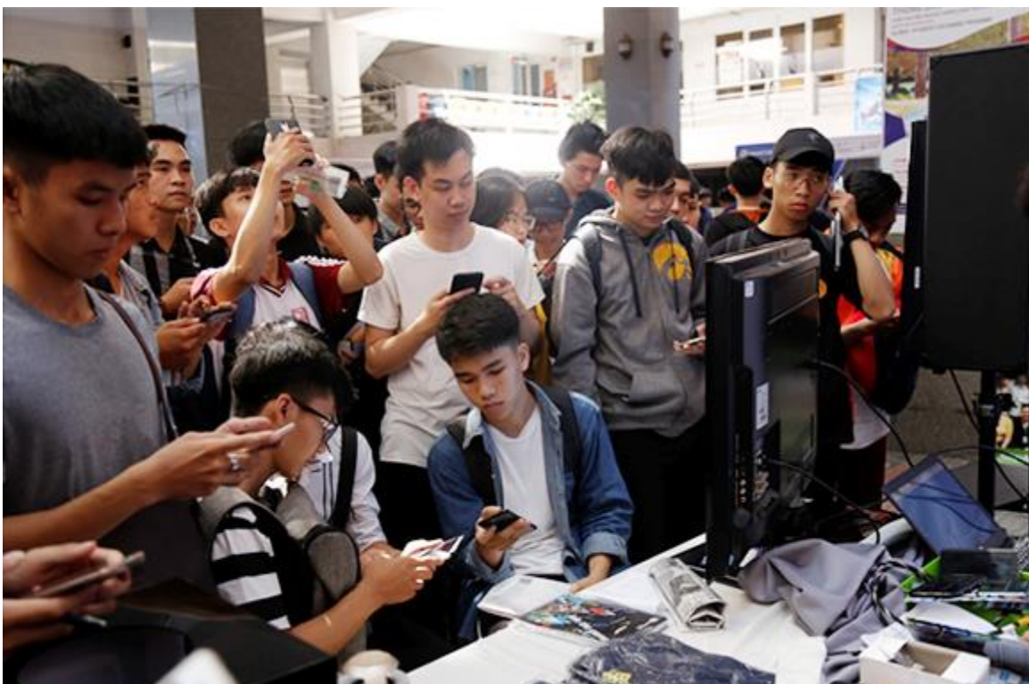
NHVL tại ĐH Duy Tân luôn thu hút nhiều SV đến đăng ký tìm việc

Một nỗ lực đáng khích lệ khác là Trường đã ký kết hợp tác với 230 DN bao tiêu đầu ra hoặc cho hỗ trợ, tạo điều kiện cho SV vừa học vừa kiến-thực tập ngay tại DN để có thêm kinh nghiệm thực tiễn, bổ sung cho lý thuyết ở trường. SV các khối ngành Kế toán, Công nghệ thông tin (CNTT), Quản trị kinh doanh, Du lịch,... học tập từ chương trình đào tạo chất lượng tại Duy Tân khi đi thực tập được nhiều các DN lớn đánh giá cao. Nhiều DN lớn về ngành Xây dựng, Kiến trúc và một số lĩnh vực khác cũng đã tìm đến ĐH Duy Tân để tuyển chọn nhân lực giỏi ngay khi đang còn học tập tại giảng đường,... Điều này lý giải rằng, một phần do chất lượng đào tạo theo xu hướng ngành nghề mà địa phương cần, một phần chính là sự chăm lo đầu ra cho SV của Ban Giám hiệu ĐH Duy Tân, tạo cho SV sự tự tin trong học tập cũng như khi tìm việc. Bên cạnh đó, đáp ứng nhu cầu tuyển dụng của DN, Trường cũng đã phối hợp tổ chức chương trình tuyển dụng chuyên đề về ngành Du lịch (năm 2017, 2018) và CNTT (lần thứ I-2019). Dự kiến trong những năm đến, ngoài NHVL thường niên, ĐH Duy Tân cũng sẽ tổ chức chương trình tuyển dụng việc làm cho các tất cả các ngành nghề khác ở các Khoa.