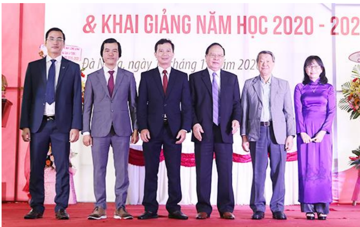
ĐH Duy Tân ra mắt lãnh đạo 5 trường đào tạo